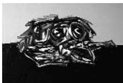
El perro de Goya. A. Saura.