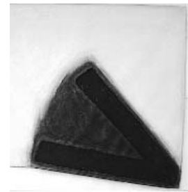
90,4. E. Becthold.

El CDAN tiene como primer objetivo estudiar y documentar rigurosamente la colección Beulas-Sarrate y, como señalan los objetivos de la Fundación, conservar, mostrar y promover la difusión de la colección donada a Huesca. Pero, si además la colección se hace pública, se transforma en una institución educadora y recreativa, y entonces su misión es reunir en torno suyo a la sociedad para ejercer sobre ella una influencia que permanecerá invisible, pero que resultará efectiva.