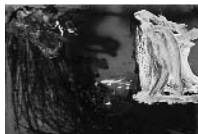
1, 2, 3. A. Saura.

La colección se centra en la obra individual de artistas significativos, representados, cada uno de ellos, por una o dos obras que van desde los primeros pintores de paisaje, a los creadores expresionistas, informalistas, abstractos, hasta la nueva figuración. Muchos de estos artistas han realizado importantes aportaciones a la historia del arte contemporáneo, otros no llegaron a alcanzar la atención nacional e internacional que deseaban, pero todos ellos fueron entrando en esa colección de carácter generalista obteniendo reconocimiento a través de la compra del coleccionista.